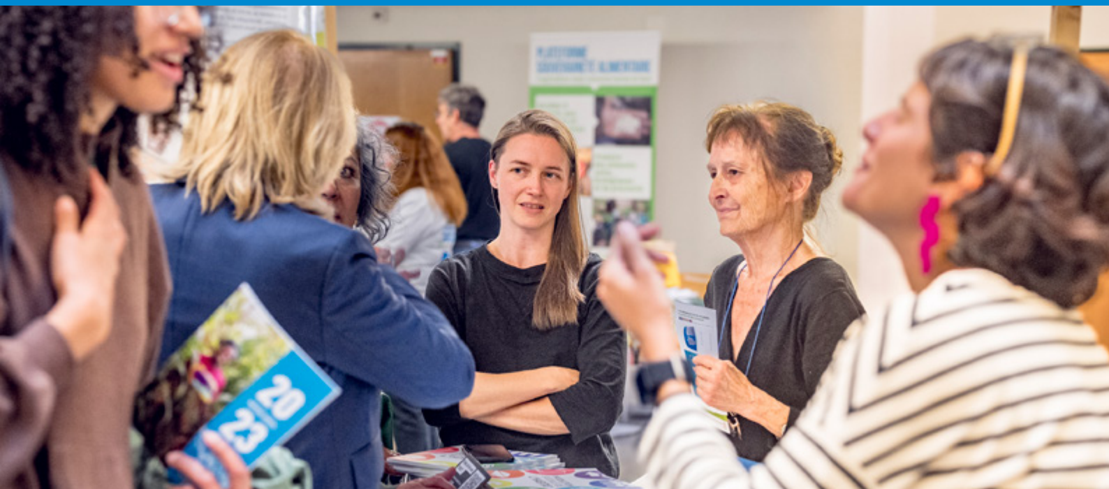
Le stand d'urbaMonde au forum des ONG qui a précédé la table ronde à l'HEPIA.