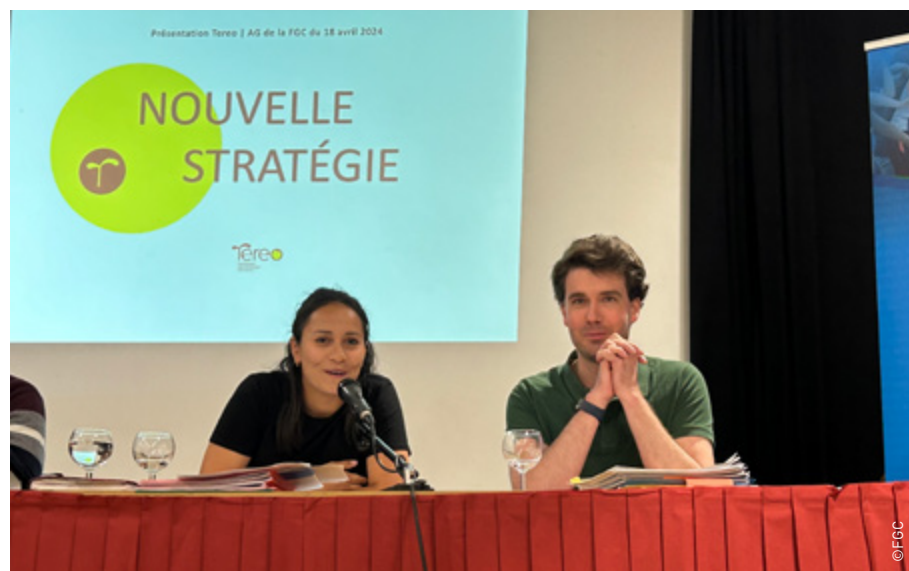
Deux bénévoles de Tereo présentent le plan stratégique de l'ONG.

Aujourd'hui, Tereo contribue à l'essor économique de plusieurs autres régions dans lesquelles l'OM intervient, en se concentrant sur la formation professionnelle des jeunes par l'implantation d'hôtels et restaurants d'application. À travers ces centres de formation et d'application, elle favorise la création d'emplois pérennes, elle participe à la promotion de la souveraineté alimentaire et s'engage pour une consommation locale et une agriculture plus responsable. L'ONG a mené ou mène des projets au Cambodge, Sénégal, Mali et Bénin. Pour la suite, elle compte étendre son action en RDC et au Cameroun. Tereo fêtera ses 20 ans le 28 septembre prochain en collaboration avec Graine de Baobab (infos complètes en page 12). ■