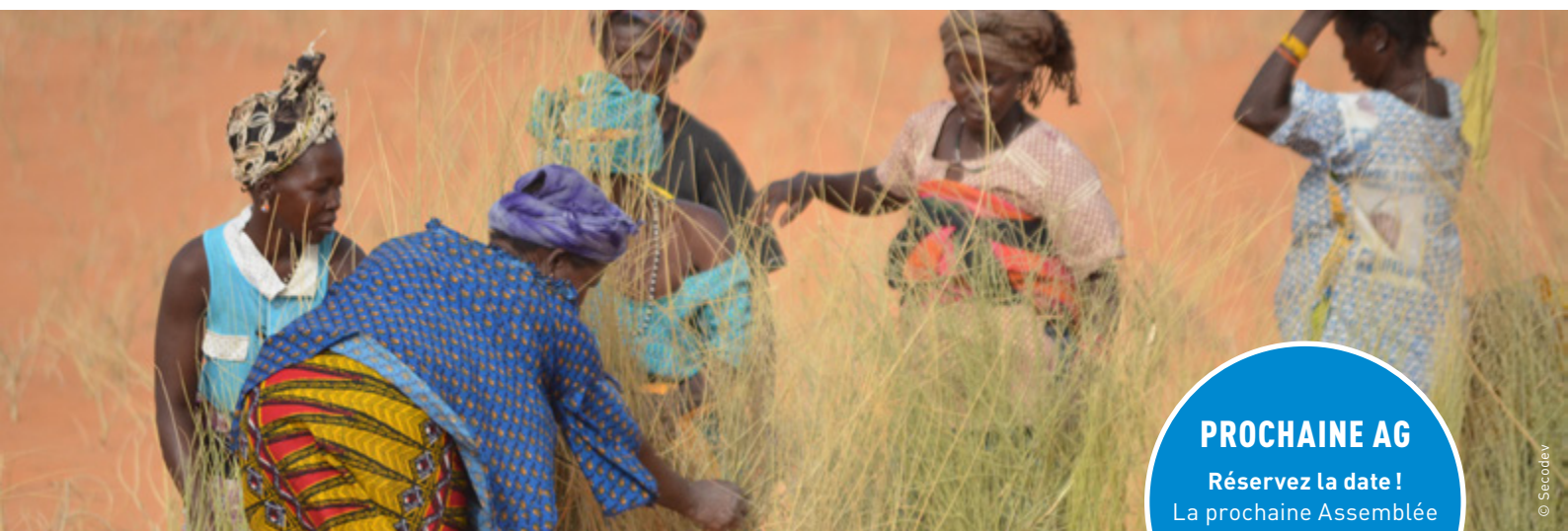
Des femmes paysannes travaillent ensemble dans les champs, au Mali.